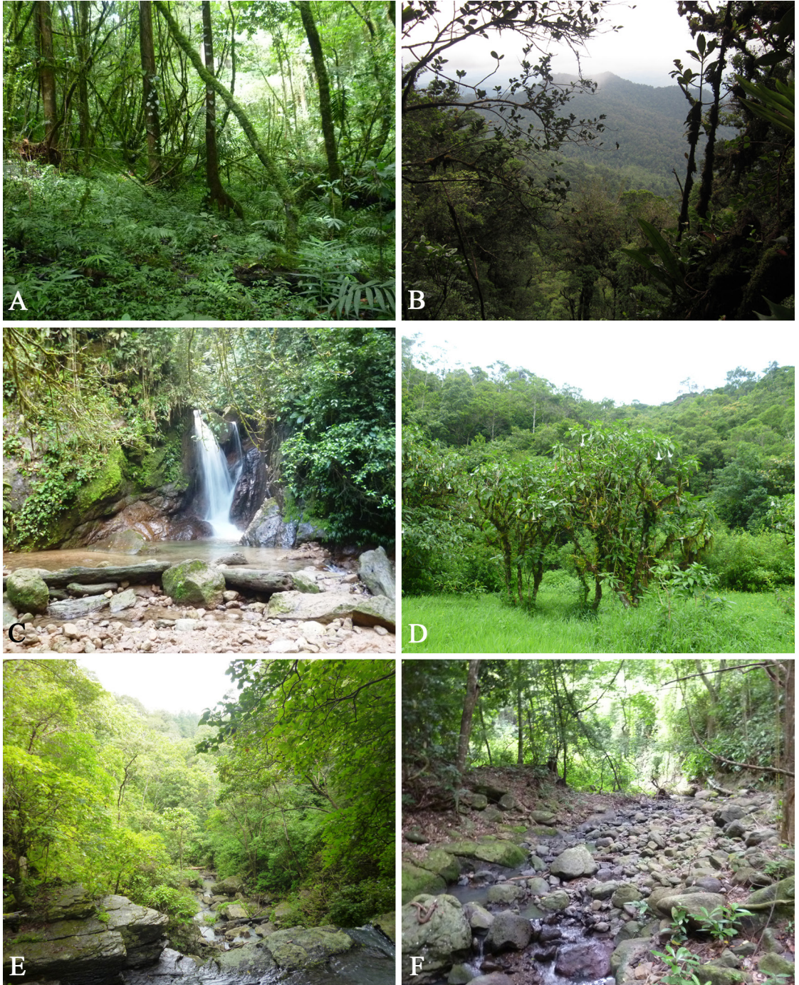
FIGURA 3. Hábitats donde crecen los nuevos registros de Honduras. A. Goodyera major . B. Maxillaria reichenheimiana . C. Microchilus killipii . D. Mormodes nagelli . E. Mormodes sotoana . F. Triphora debilis .